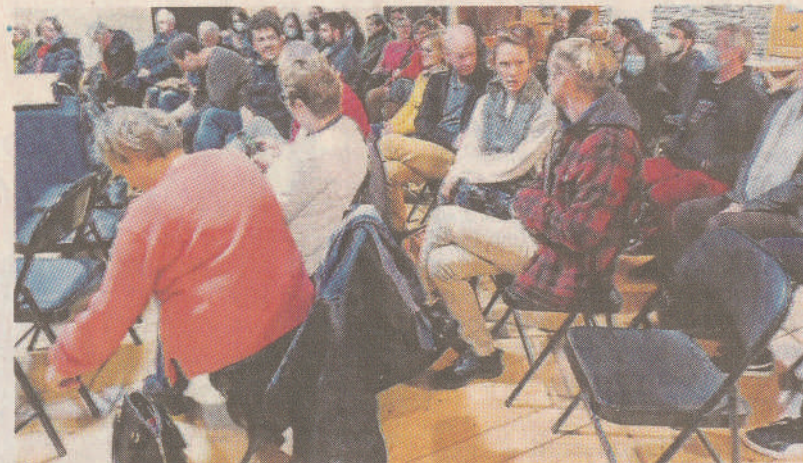
Le public a apprécié l'avant-première du court métrage « Réminiscence ».