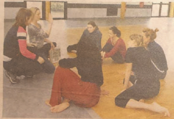
Ci-dessus et ci-dessous : Lors des premières séances de répétition ce mardi 28 septembre

Le court-métrage, d'une dizaine de minutes, met en scène les danseuses à travers les dif-