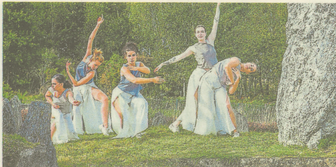
La chorégraphie a été créée en fonction des différents monuments du site mégalithique de Saint-Just.

À la fois compagnie de spectacle vivant et structure de production, l'association Indiscernable, créée en 2018, est basée à Rennes. Elle réunit